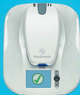
MyCareLink монитор пациента