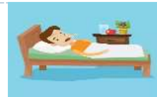
Прием на дому