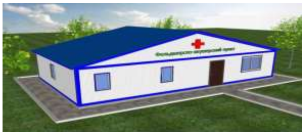
Прием на ФАПе