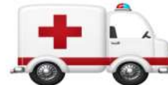
Выезд в соседние населенные пункты

Деревни ПГТ малонаселенные отдаленные труднодоступные пункты