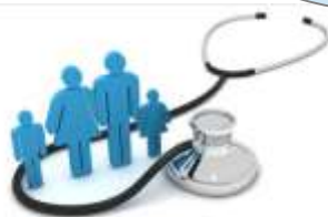
Этика и долг