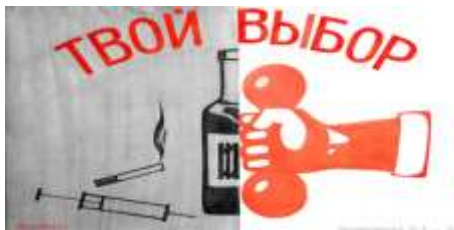
Профилактическая работа с подростками