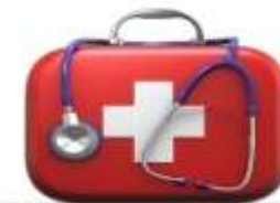
Способность действовать в нестандартных ситуациях